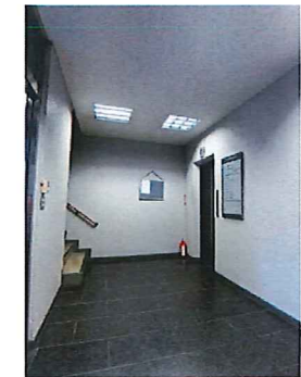
【エレベーターホール】