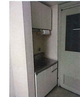
【共用部ミニキッチン】